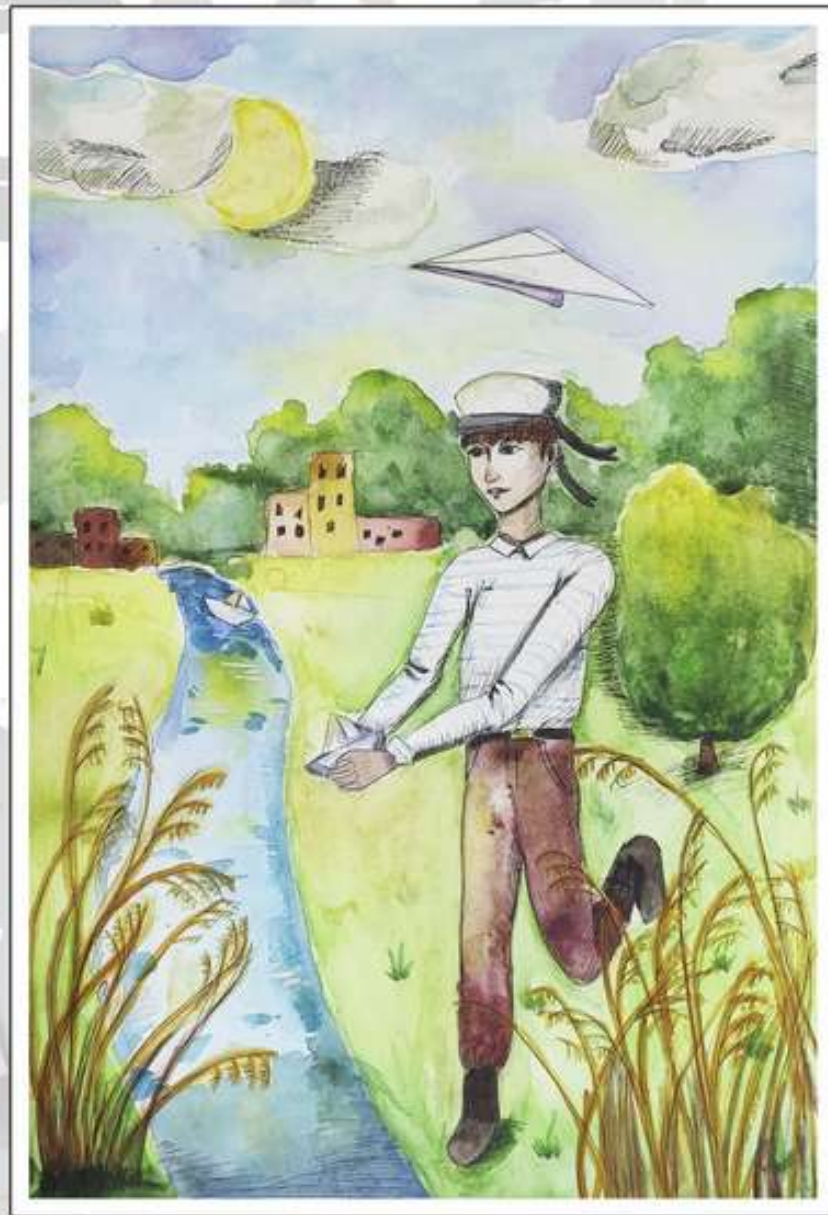
Хатит Евгения, 13 лет