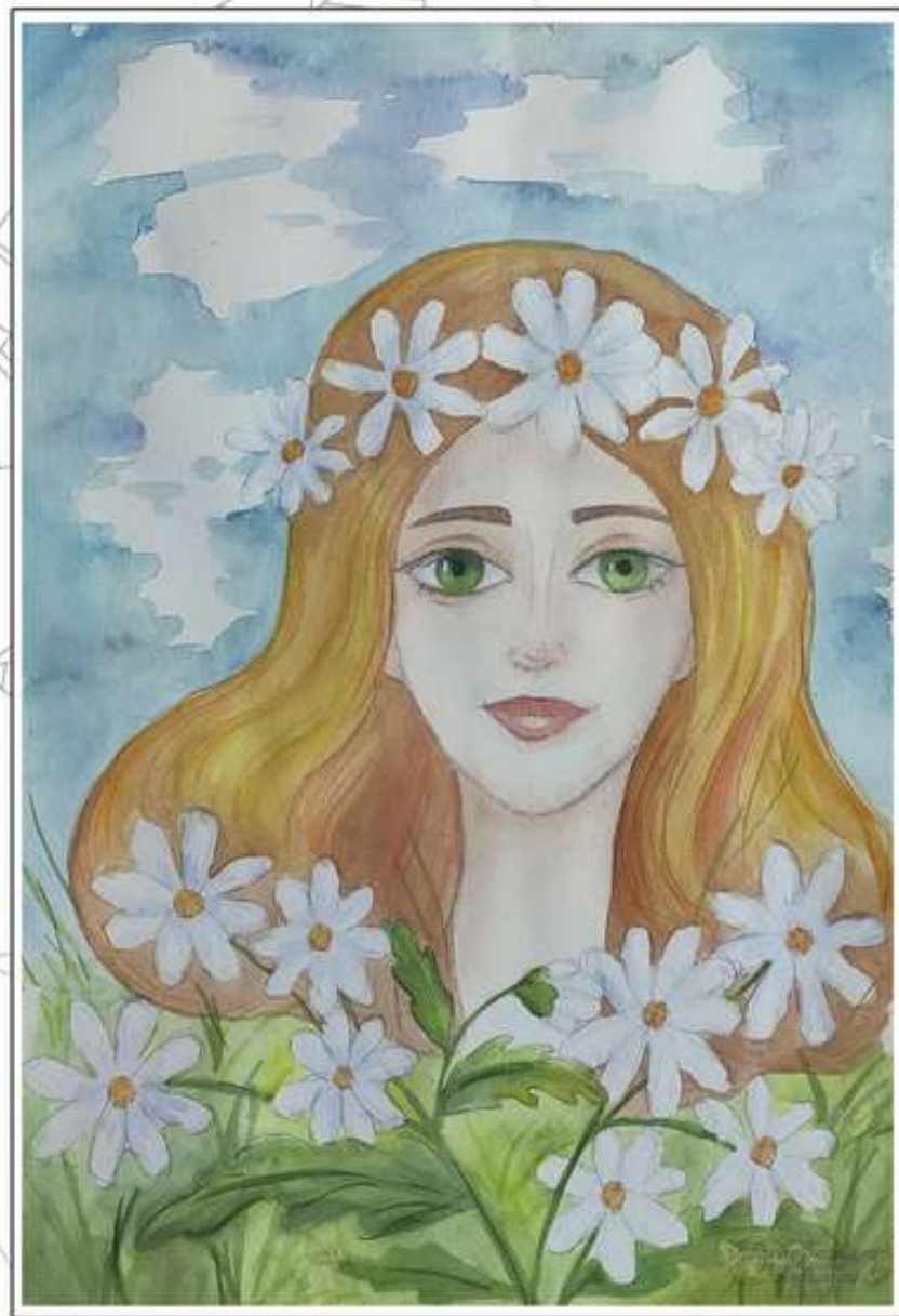
Рубайко Вероника, 14 лет