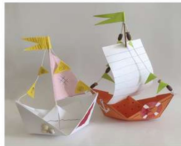
Мамонтов Максим, 10 лет