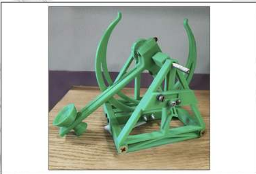
Скоробогатько Максим, 14 лет