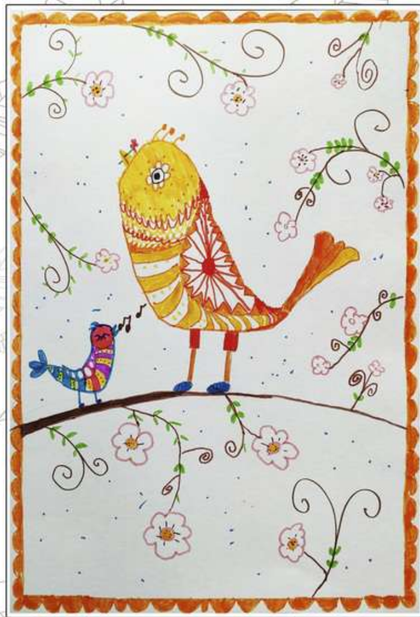
Мамонтов Максим, 8 лет