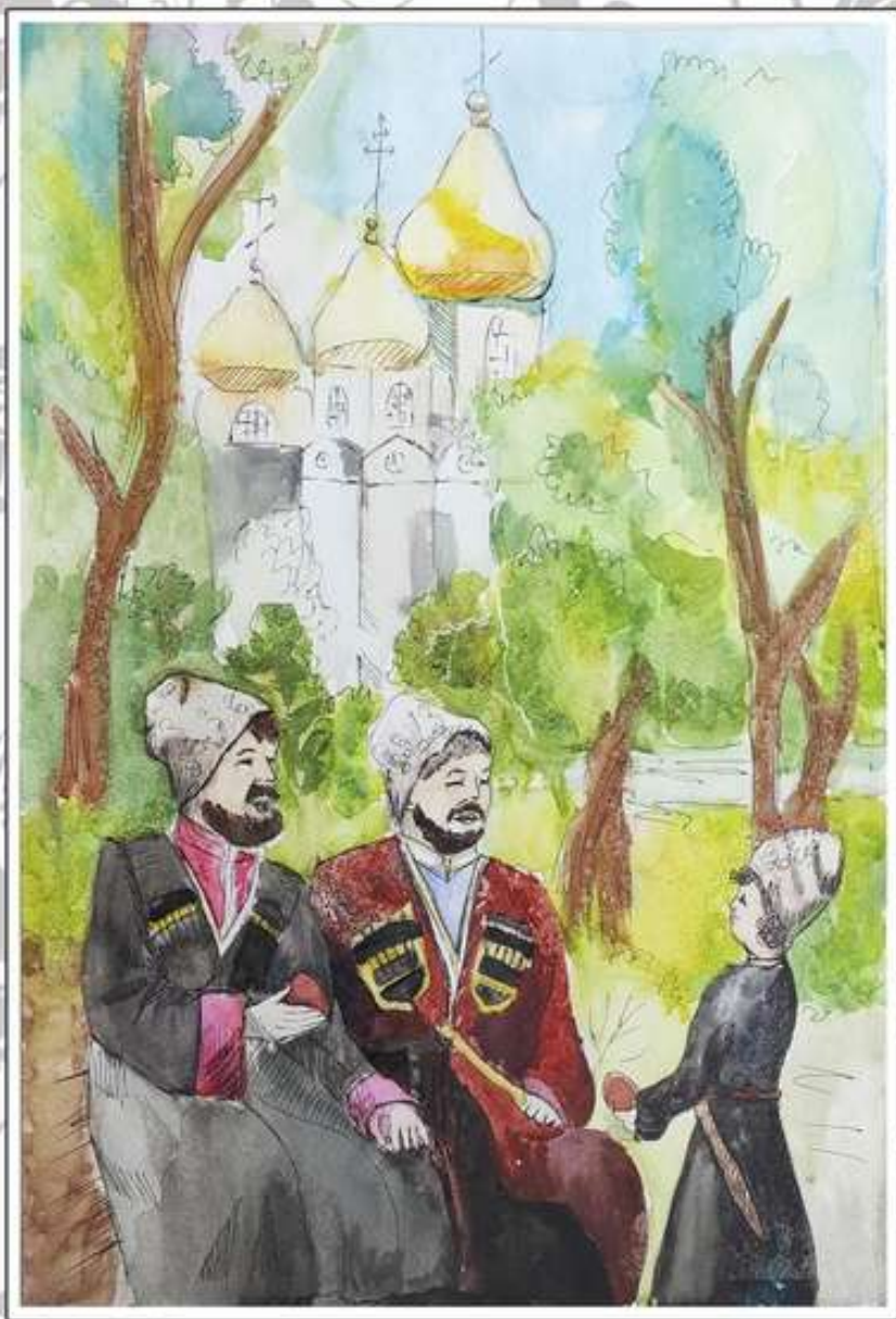
Закурдаева Виолетта, 13 лет